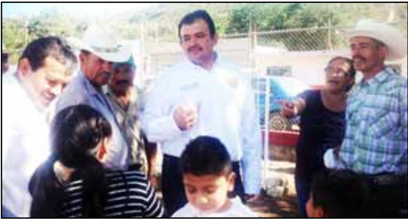
Participa en festejos de colonia de 6 de enero