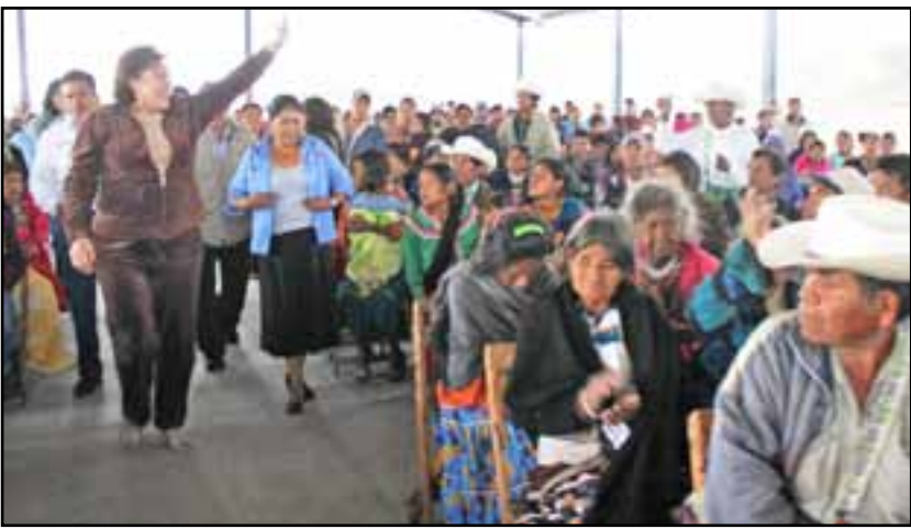
Entrega apoyos a familias en El Nayar