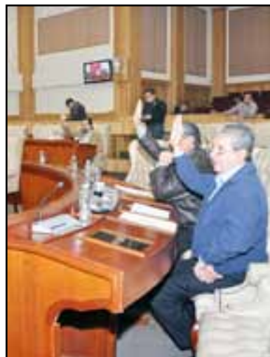
Convoca a Periodo Extraordinario de Sesiones