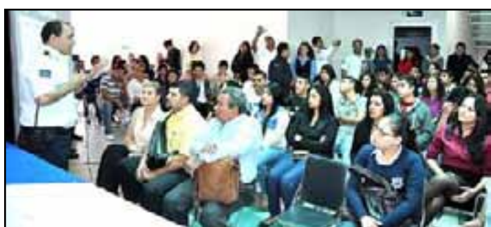
Para prevenir accidentes