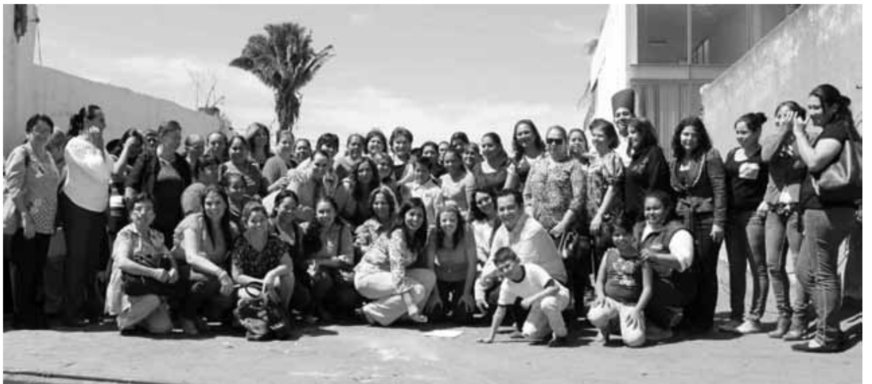
Casa de Enlace es punto de capacitación

Durante el 2013 también se prevé aumentar “sustantivamente” el número de escuelas de tiempo completo y próximamente el Presidente enviará al Senado su propuesta de ternas para la designación de los integrantes de la Junta de Gobierno del INEE.