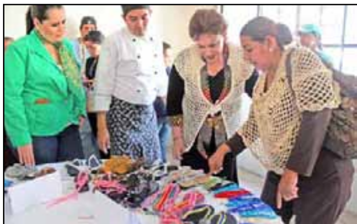
Casa de Enlace es punto de capacitación